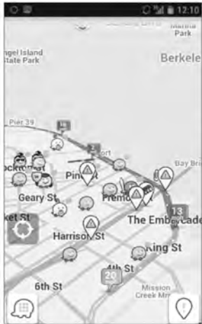
Waze က user တွေတည်ရာနဲ့ လမ်းကြောင်းပေးပို့တဲ့ ဝန်ဆောင်မှုပေးနိုင်တဲ့အခြေအနေအထားတွေကို ပြသပေးထားပါတယ်။

Android နဲ့ iOS ၊ ခုလုံးမှာ အသုံးပြုနိုင်တဲ့ ကောင်း မှန်တဲ့ တခြား app တစ်ခုက WeatherBug ဖြစ်ပါတယ်။ ရာသီဥတုဆိုင်ရာ ခန့်မှန်းမှုတွေကို မြင်တွေ့နိုင်ပြီး ကိုယ် ရှိတဲ့နေရာအပေါ်မှတည်ကာ သတင်း update တွေကို အမြဲရနိုင်ပါတယ်။ သတင်းတွေအတွက်ဆိုရင်တော့ Android၊ iOS ၊ Web OS တွေအတွက် Zite ကို အသုံးပြုနိုင် ပါတယ်။ ကိုယ်ကြိုက်နှစ်သက်ရာ သတင်းတွေကို စိတ် ကြိုက် customize လုပ်ပြီး ဖတ်ရှုနိုင်ပါတယ်။ Twitter account က update တွေကိုလည်း မြင်တွေ့နိုင်ပါတယ်။ သတင်းနဲ့ပတ်သက်တဲ့ ကောင်းမွန်တဲ့ app များတစ်ခု မှာ Pluse ဖြစ်ပါတယ်။ iOS မှာဖြစ်ဖြစ်၊ Android မှာဖြစ် ဖြစ် ကိုယ်ကြိုက်နှစ်သက်ရာ ကဏ္ဍအလိုက် website တွေ ကို မှတ်ထားနိုင်ပြီး stream လုပ် ဖတ်နိုင်ပါတယ်။ Pluse က တစ်ဆင့် သတင်းဖတ်တဲ့အခါ ကြော်ငြာတွေကြောင့် အနောင့်အယုက်မဖြစ်တော့ဘဲ mobile web browser