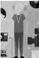
Crackle က မှောင်ကြီးရင်ရင် တွေ ၊ TV series တွေကို computer ပေါ်မှာ connected TV မှာနဲ့ mobile ပစ္စည်းတွေပေါ်မှာ stream လုပ်ပြသပေးနိုင်ပါတယ်။

အနုပညာဖန်တီးမှုတွေ ဝါသနာပါသူတွေအတွက် photo တွေကို လှုပ်ရှားနေတဲ့ gif file တွေအနေနဲ့ ပြောင်း လဲပြီး social media တွေမှာ တင်ထားချင်ရင် Instagram နဲ့ပုံစံတူတဲ့ Cinemagram ကို အသုံးပြုနိုင်ပါတယ်။ ရှည် လျားတဲ့ video file project တွေပြုလုပ်ချင်ရင် Light works (beta version) ကို အသုံးပြုနိုင်ပါတယ်။ အဲဒီ desktop video editing software suite ဟာ open source ဖြစ်ပြီး video တွေကို import လုပ်တာ၊ edit လုပ်တာတွေကို