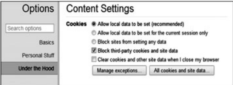
Chrome နဲ့ တခြား browser တွေက cookies တွေကို ဝိသေသနဲ့ဖျက် ဖျက်လို့လည်းရပါတယ်

Firefox နောက်ဆုံး version ကို သုံးထားတယ်ဆိုရင်တော့ Firefox menu အောက်က Options ကို ရွေးပါ။ ပြီးရင် Options ကိုပဲ ထပ်ရွေးပါ။