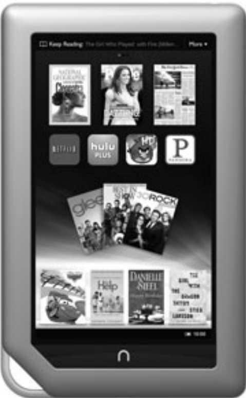
Nook Tablet ကတော့ ရောင်စုံ e-reader ဖြစ်ပြီး ပုံတွေကို ပြသ ပေးနိုင်ပြီး video တွေကိုလည်း play လုပ်နိုင်ပါတယ်

နှိပ်လို့ရတဲ့ volume button တွေပါဝင်မှု၊ storage ကို 32GB အထိ တိုးမြှင့်နိုင်မယ့် Micro-SDHC card slot ၊ အလင်း မပြန်တဲ့ display စတာ တွေကြောင့် Nook tablet က ပိုအဆင့်မြင့်ပါ တယ်။ စာရေးသူအနေနဲ့ တော့ Nook ထက်စာရင် Kindle Fire ကို ပိုကြိုက် ပါတယ်။ ဒါပေမဲ့ Fire ရဲ့ power button ဟာ မတော်တဆ မှားနှိပ်မိ တတ်ပြီး speaker တွေ