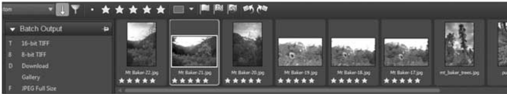
Photo အသစ်တွေကို browse လုပ်ချင်ရင် Corel ရဲ့ After Shot က လွှဲပြောင်းလွယ်ကူစွာနဲ့ လုပ်ပေးနိုင်ပြီး မျောက်ပိုင်သုံးစွဲအတွက် import ကို save ထားနိုင်ပါတယ်။

Lightroom ကို digital photo ပညာရှင်တွေအတွက် optimize လုပ်ထားတာပါပဲ။ နောက်ဆုံး version ကို လုံးဝပြောင်းလဲဆန်းသစ် ထားတာ မဟုတ်ပေမယ့် အရေးပါတဲ့ feature အသစ်တွေ အများကြီး ထည့်သွင်းပေးထားပါတယ်။