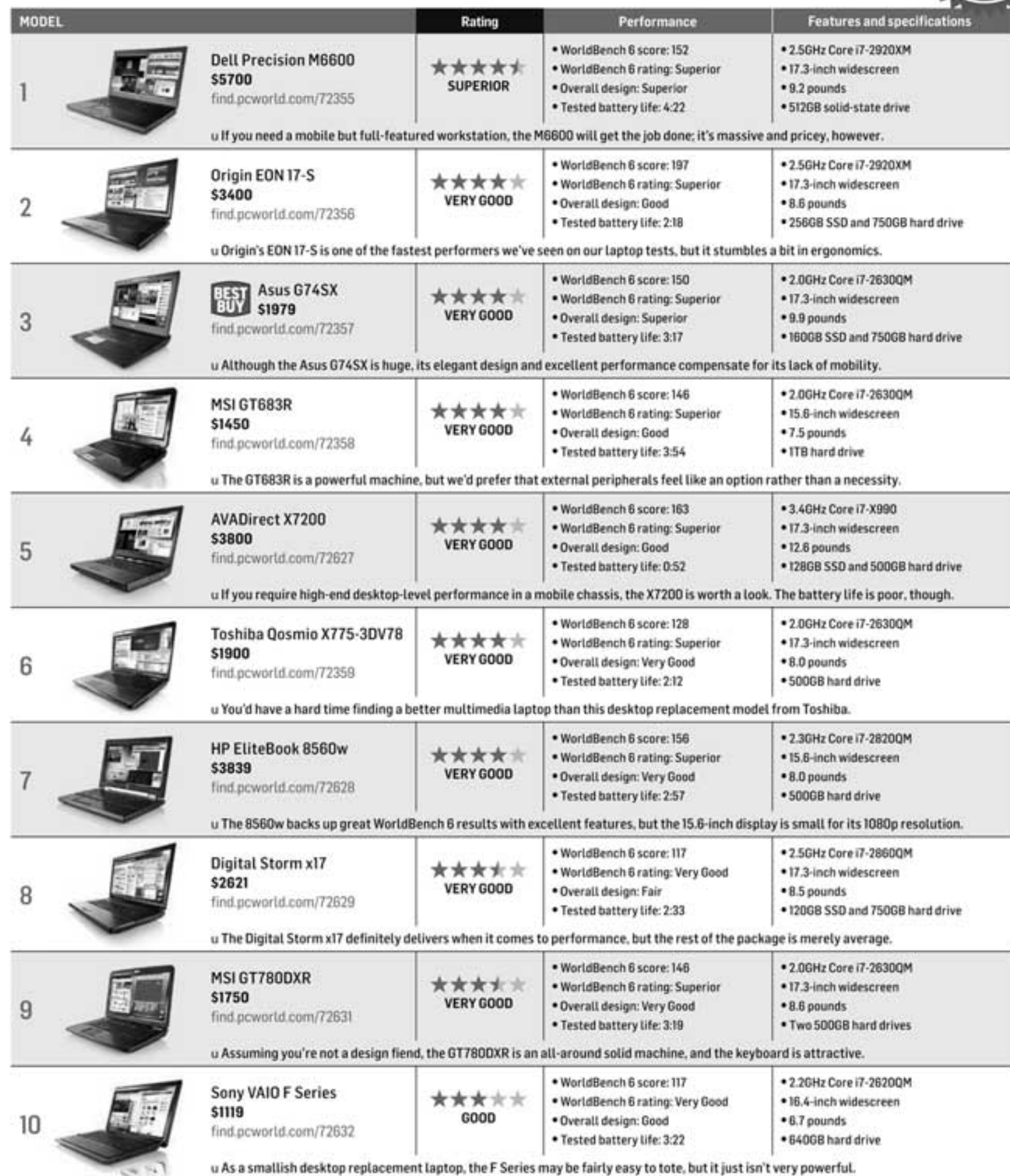
CHART NOTES: Ratings are as of 4/27/12. Tested battery life is expressed in hours:minutes. Listed weights do not include the power adapter.