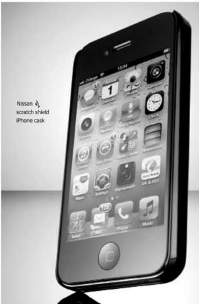
Nissan ရဲ့ scratch shield iPhone cask

ဒါကအရမ်းကောင်းတဲ့ plastic ဖြစ်တာကြောင့် သုတေသီ တွေက မြင့်မားတဲ့အပူချိန်ကိုပါ ခံနိုင်တဲ့နည်းပညာကို ဆက်လက်ကြိုးစားလုပ်ဆောင်နေပါတယ်။ ■