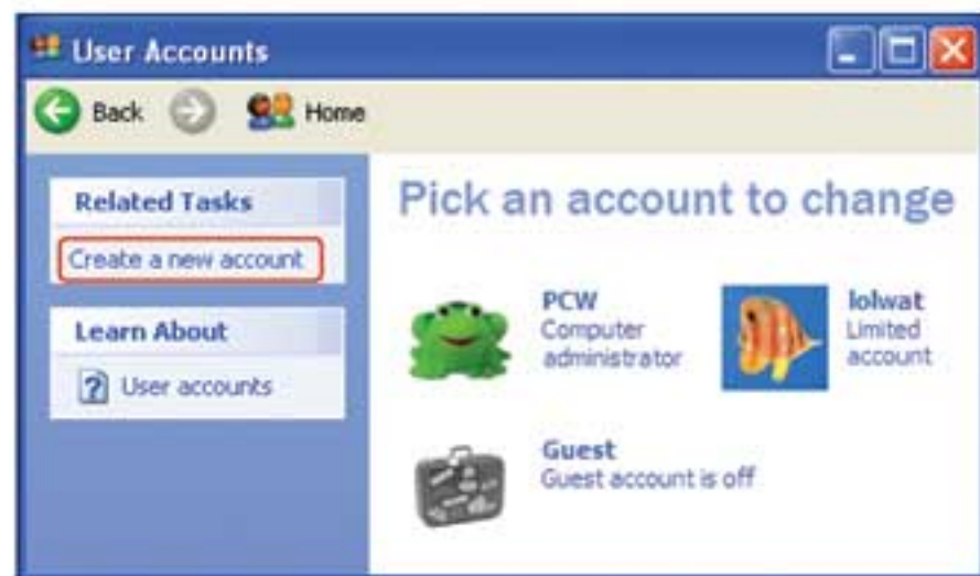
Windows Manage Account ထဲမှာ account အသစ်တစ်ခုကို အလွယ်တကူ ဖန်တီးနိုင်ပါတယ်။

assignment တွေကို သီးခြားစီစုစည်းထားပေးနိုင်မှာဖြစ်ပါ တယ်။ ဒီလို ပြုလုပ်ဖို့ တစ်ဆင့်ပြီးတစ်ဆင့် လုပ်ဆောင်ရမယ့် အချက်တွေကို ဖော်ပြပေးလိုက်ပါတယ်။