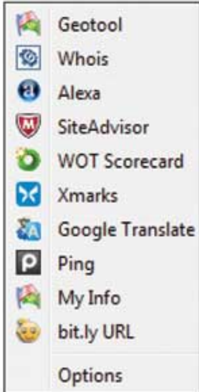
Site တစ်ခုရဲ့ host တည်နေရာကို သိရှိ နိုင်ဖို့ Flagfox က browsing tool တွေ ပေးထားပါတယ်

တော်သလို ရွေးချယ်ပါ။ တပ်ဆင်ဖို့က မိနစ်အနည်းငယ်ပဲ ကြာပါတယ်။ ဒီနည်းနဲ့ ကိုယ်က hard drive ကို removeable storage အနေနဲ့ သုံးနိုင်မှာဖြစ်ပါတယ်။ မသေချာတာ တစ်ခု ကတော့ Recuva က အဲဒီ device ကို recognize လုပ်နိုင် မလားဆိုတာပါပဲ။ မဟုတ်ရင်တော့ ပိုပြီးကောင်း မွန်တဲ့ recovery utility လိုအပ်ပါလိမ့်မယ်။