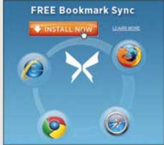
အခမဲ့ Xmarks service က major web browser ၄ ခုကို ထောက်ပံ့ပေးပြီး bookmark တွေကို synchronize လုပ်နိုင်ပါတယ်

ဒါကြောင့် ကိုယ့်ကိုယ်ပိုင်မဟုတ်တဲ့ computer မှာ အဲဒီလိုလုပ်မယ့်အစား my.xmarks.com ကိုသွားပြီး log on ဝင်ရင် အခြားသူရဲ့ browser ကို ဘာအပြောင်းအလဲမှ မရှိစေဘဲ ကိုယ့်ရဲ့ link တွေကို ဝင်ရောက်နိုင်မှာ ဖြစ်ပါတယ်။