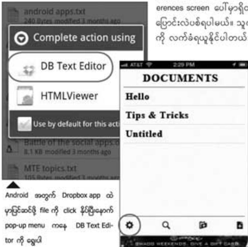
Android အတွက် Dropbox app ထဲ မှာပြင်ဆင်ဖို့ file ကို click နှိပ်ပြီးနောက် pop-up menu ကနေ DB Text Editor ကို ရွေးပါ

ဒီ software ၂ ခုနဲ့ .txt ၊ .html လို ရိုးရှင်းတဲ့ပုံစံ text တွေကို ပြင်ဆင်နိုင်ပေမယ့် တခြားပုံစံပြောင်းလဲချက်တွေအတွက် ပိုပြီး အသုံးကျတဲ့ tool တစ်ခု လိုအပ်ပါတယ်။ တကယ်လို့ ကိုယ်သွားလေရာ နေရာကနေ ပြင်ဆင်မှုအများကြီးလုပ်နေရတယ်ဆိုရင် Quickoffice လိုမျိုး လုပ်ဆောင်ချက်တွေ ပြည့်စုံတဲ့ editor မျိုးကို စဉ်းစားကြည့်နိုင်ပါတယ်။ ဒီလိုမျိုး editor တွေကို သုံးမယ်ဆိုရင်တော့ ငွေကြေးကုန်ကျမှုတစ်ချို့ ရှိလာပါလိမ့်မယ်။