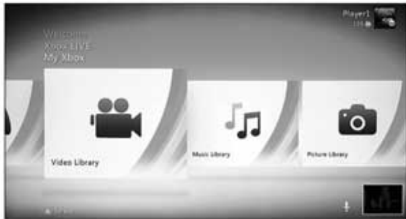
ကိုယ့် computer ရဲ့ media ကို Xbox 360 dashboard ကနေ access လုပ်နိုင်ပါတယ်

Media ကို တခြား တစ်နေရာရာမှာ သိမ်းထားတယ်ဆိုရင် file တွေ WMP ဆီ import ပြုလုပ်ပေးပါ။ Libraries view အဖြစ် WMP ကို ဖွင့်ပါ။ Organize ကို click နှိပ်ပြီး manage libraries ကို ရွေးချယ်ပြီး music ၊ pictures ၊ ဒါမှမဟုတ် videos ကိုရွေးပါ။ Folder တွေကို library location Windows ထဲထည့်ပါ။ Libraries view အောက် မှာ sharing လုပ်ပေးနိုင်ဖို့ stream ကို click နှိပ်ပြီး automatically allow devices to play my media ကို ရွေးပါ။ Stream ကို နောက်တစ်ကြိမ် click ထပ်နှိပ်ပြီး more streaming options ကိုရွေးပါ။ ဒီနေရာမှာ media library ကို နာမည်ပေးပါ။ ဒီ screen မှာ library ကနေ လက်ခံရယူနိုင်တဲ့ networked device တွေကိုလည်း ဖော်ပြပေးပါလိမ့်မယ်။ Xbox 360 နဲ့