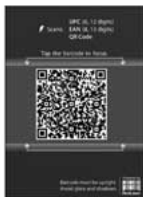
RedLaser ဟာ QR codes ကို ဖတ်ပေးနိုင်ပြီး bar codes ကိုလည်း ဖတ်ပေးနိုင်ပါတယ်

QR (Quick-Response) code တွေဟာ နေရာတိုင်းမှာ ရှိနေပါတယ်။ ယင်းတို့ဟာ web links ၊ စာသား၊ phone နံပါတ်၊ email လိပ်စာ၊ ဒါမှမဟုတ် calendar event တွေကို သိမ်းဆည်းထားနိုင်ပြီး SMS message တွေ ပို့နိုင်ပါတယ်။ သူတို့ကိုဖတ်နိုင်ဖို့ ကိုယ့်ရဲ့ camera တပ်ဆင်ထားတဲ့ phone ၊ ဒါမှမဟုတ် tablet အတွက် QR-code app တစ်ခု လိုအပ်ပါတယ်။ RedLaser ကို iOS ( find.pcworld.com/72555 ) ၊ ဒါမှမဟုတ် Android ( find.pcworld.com/72556 ) စမ်းသုံးကြည့်ပါ။ Android အတွက် နောက်ထပ် ရွေးချယ်မှုတစ်ခု