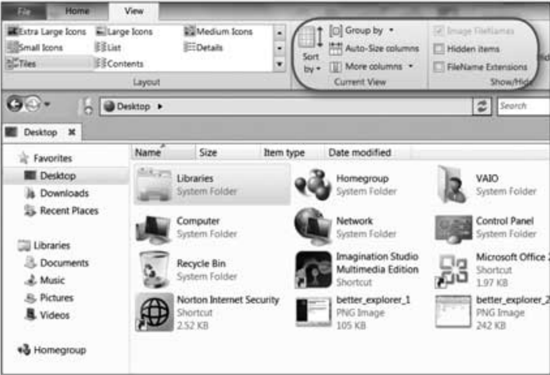
Windows Explorer အဖြစ်ပြောင်းလဲနိုင်တဲ့ BExplorer ဟာ Ribbon ပုံစံလိုနဲ့ context-sensitive tab တွေပေါ်ပြန်ပြီး view နဲ့ sort ရွေးချယ်မှုလို file စီမံခန့်ခွဲမှုလုပ်ဆောင်ချက်တွေ လိုက်လျောညီထွေ လုပ်ဆောင်ပေးပါတယ်။

Windows 8 ဟာ Windows Explorer ထဲရှိ toolbar နေရာမှာ Office-style ribbon တစ်ခုနဲ့ အစားထိုးလာပါလိမ့်မယ်။ ကိုယ်အလုပ်လုပ်နေတဲ့အပေါ်မူတည်ပြီး ရွေးချယ်နိုင်တာတွေဟာ ပြောင်းလဲနေပါတယ်။ တကယ်လို့ file တွေအတွက် ribbon လို interface တစ်ခုကို အခု အသုံးပြုချင်ရင် BExplorer (Better Explorer) ကို သုံးနိုင်ပါတယ်။ Windows Explorer အတွက် အပြောင်းအလဲတစ်ခု ဖြစ်ပါတယ်။ နောက်ဆုံး version ဖြစ်တဲ့ better explorer ကို (find.pcworld.com/72569) ကနေ download ပြုလုပ်ပြီး website ကနေ executable file ကို တိုက်ရိုက် ဖွင့်နိုင်ပါတယ်။ BExplorer ဟာ setup အနည်းငယ်ပဲပြုလုပ်ဖို့ လိုအပ်ပါတယ်။ Program ကိုထည့်သွင်းပြီးတာနဲ့ My Computer ကို အသုံးပြုမယ့်အစား BExplorer ရဲ့ Start menu shortcut ကနေ file တစ်ခုကို ဖွင့်နိုင်ပါတယ်။ File ၊ Home နဲ့ View စတဲ့ Ribbon-style tab ၃ ခု ပါရှိပါတယ်။