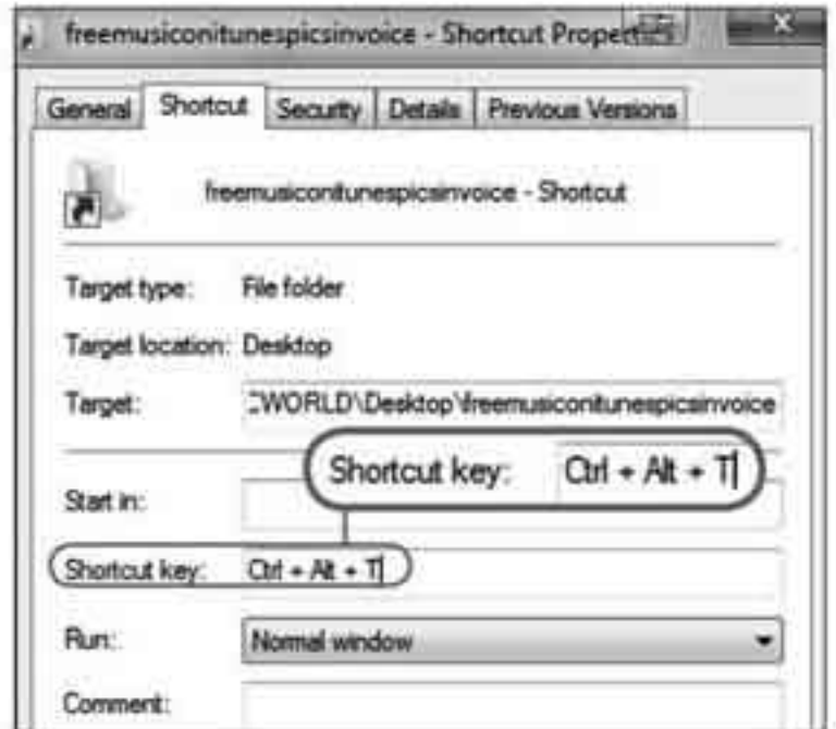
နောက်ဆုံးအဆင့်မှာ ကိုယ်သတ်မှတ်ချင်တဲ့ key အတွဲတွေကို နှိပ်ပါ