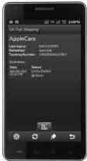
Parcels Android app က ကိုယ်ရဲ့ ကုန်ပစ္စည်းမှာယူမှု တွေကို တောကြည့်ရာမှာ ကူညီ နိုင်ပါတယ်

စာရေးသူက package တွေ အများအပြား လက်ခံရလေ့ ရှိ ပါ တယ်။ စာရေးသူရဲ့ online shopping အကျင့်နဲ့ နည်း ပညာ ကုမ္ပဏီတွေက သူတို့ရဲ့ gadget နဲ့ တခြားအရာတွေကို စမ်းသပ်ဖို့ ပို့ပေးတာတွေကြောင့် DHL၊ FedEx၊ OnTrac နဲ့ UPS က driver တွေနဲ့ အသိ မိတ်ဆွေတောင် ဖြစ်နေပါပြီ။