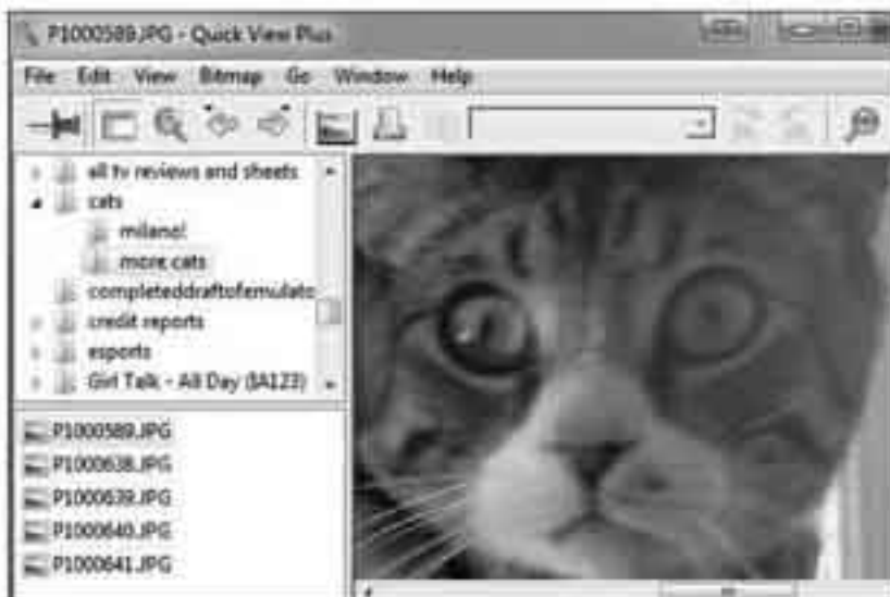
Quick View Plus က file အမျိုးအစား ၃၀၀ ကျော်ကို ပြသပေးနိုင်ပါတယ် (မိလေပဲ့ multimedia file တွေ မပါပါဘူး။)