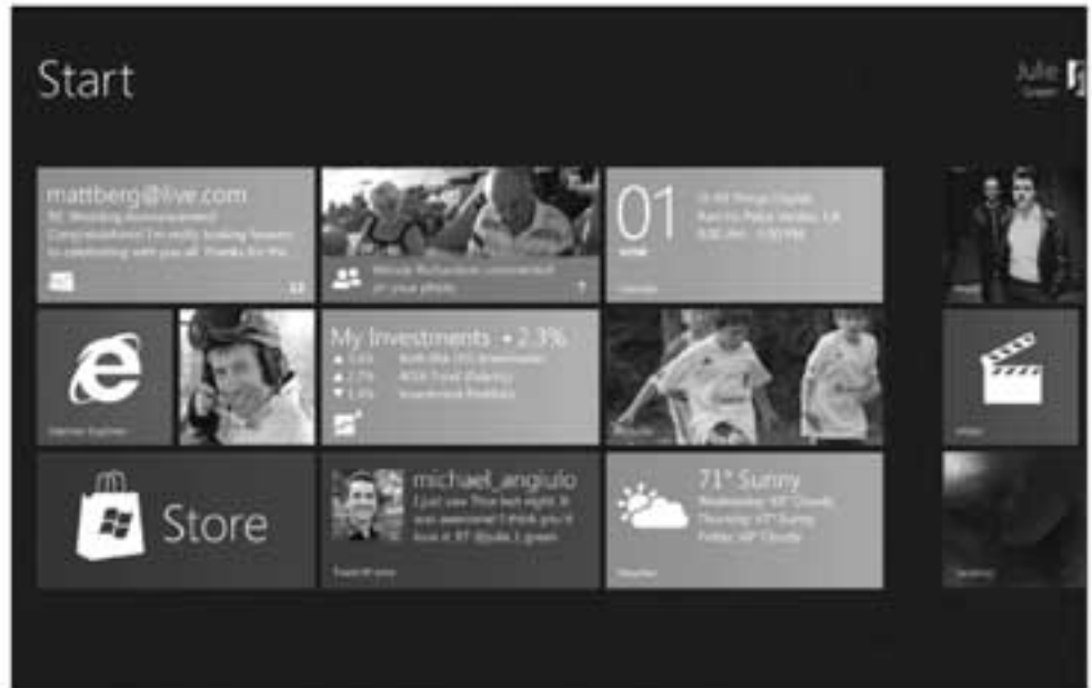
Windows Phone 7 နဲ့ တော်တော်တူတဲ့ပုံစံတွေ ပါလာတာနဲ့အတူ၊ Windows 8 ဟာ သူ့ရော OS တွေရဲ့ Windows-and-menu-desktop ပုံစံတွေကနေ ကွဲထွက်လာပါတယ်

Microsoft ဟာ OS အသစ်မှာပါဝင်လာတဲ့ အင်္ဂါရပ် အသစ်တွေကိုလည်း video နဲ့ တင်ပြသွားပါသေးတယ်။ အထင်ရှားဆုံးကတော့ Windows 8 ကို laptop နဲ့ desktop computer တွေအတွက်သာမက၊ tablet computer တွေအတွက်ပါ design လုပ်ထားတယ်ဆိုတာပါပဲ။ ဒါ့ကြောင့် ကြီးမားပြီး ထိတွေ့သုံးဖို့ အဆင်ပြေတဲ့ ခလုတ်တွေ၊ အမြင်ပိုင်းဆိုင်ရာ ပုံစံတွေ ပါဝင်လာပါတယ်။ Microsoft ရဲ့ ပြောကြားချက်အရ ဒီလို လေးထောင့်ကွက် ကြွေပြားပုံစံ interface ဟာ အခုလက်ရှိသုံးနေကြ start menu ကို အစားထိုးသွားမယ်လို့ ဆိုပါတယ်။ အဲဒီပုံစံကို