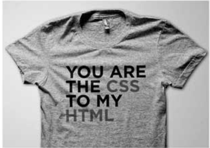
ဟာသဆန်တဲ့ဆောင်ပုဒ်တွေ ကတ်ထားတဲ့ ဒီလို Pop+Shorty က ရုပ်အင်္ကျီမျိုးဟာ ကိုယ့်ရဲ့ Geek ဖြစ်ရတာ ဂုဏ်ယူကြောင်း ပြသဖို့ နည်းလမ်းကောင်းတစ်ခုဖြစ်ပါတယ်

Geek နဲ့ပတ်သက်တဲ့ ဆောင်ပုဒ်တွေ၊ design တွေ လိုချင် ရင်တော့ online မှာ ရှာနိုင်ပါတယ်။ Pop+Shorty (www.