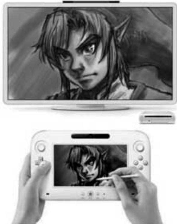
Controller ပေါ်မှာဆွဲရတာက Wii U ပေါ်မှာရနိုင်တဲ့ လုပ်ဆောင်ချက်တွေထဲက တစ်ခုဖြစ်ပါတယ်

Nintendo ဟာ ဒီပစ္စည်းရဲ့ အသေးစိတ်အချက်အလက် တွေကိုတော့ ထုတ်ဖော်ပြောကြားခြင်း မရှိသေးပါဘူး။ ဒါပေမဲ့ အစမ်းကြည့်ရသလောက်တော့ သူ့ရဲ့ processing power က တော့ အထင်ကြီးစရာပါပဲ။ High def လည်း ရပါတယ်။ အရင် က ထွက်ရှိခဲ့တဲ့ Wii game တွေ၊ Wii remote controller တွေနဲ့ Wii တွဲဖက်ပစ္စည်းတွေအားလုံးနဲ့ အဆင်ပြေပါတယ်။ ဒါပေမဲ့